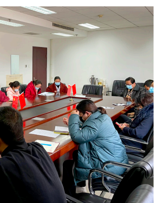
支部增派新鲜血液。

基础上，继续完成2月份立足岗位谋发展，结合周围血管科、乳腺科、泌尿科外工作特点，提出了提升诊疗能力，加强中医特色建设的发展意见。3月份按照医院党委全面从严治党的工作安排，加强支部党的建设，积极申报校级样板党支部。同时按照习近平总书记在学习教育动员大会上的重要讲话精神，认真撰写党史学习笔记，结合支部发展史上，先后作为校级先进基层党组织、院级先进基层党组织开展的社区义诊服务、党员项目化管理、建国70周年群众庆祝游行、武汉抗疫等重点工作总结成册，总结经验，激励进步。4月计划与二七院区党支部等联合组织活动，参观二七纪念馆，传承红色基因，丰富东方精神。5月重温入党誓词，结合医疗工作深入开展党史学习。6月深入学习党章党规，坚定理想信念。7月按照医院党委工作安排，参加医院举办的建党