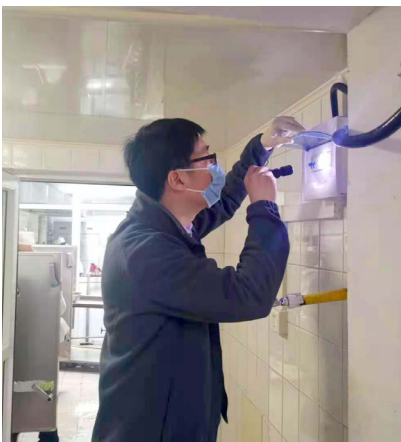
今年2月创卫工作开展以来，安排专人清理公共卫生区域、清理卫生死角百余次，对生活垃圾站、医疗垃圾站进行彻底清洗、消毒、消毒工作共计14次，对外围154个雨篦子进行每日多次不定期巡检，发现垃圾及时清扫，对医院围栏

外地沟进行清扫整顿。自接到创卫任务以来，保洁对全院区内外环境增加清洁、巡查频次，对外围所有区域内大厅、药房、收费窗口、公共区域内的玻璃进行彻底清洗刮擦，从原本的一到两个季度刮擦一次增加到每个季度刮擦六次，外围不锈钢扶手及标牌坚持每日擦拭一次。食堂从2月起坚持每两周进行一次“搬家式”“搓澡式”扫除，4月检查前夕增加至每两天一次，共完成大扫除二十余次。与此同时，食堂员工积极参与灭鼠灭蟑工作，食堂一直坚持每月消杀病媒生物，接到创卫任务以来增加至每月2次，从3月起更是协助满天星物业公司完成了7次消杀工作，与此同时食堂还增补了粘鼠板、粘蟑板并坚持每天更换。食堂职工还坚持每天巡视寻找漏洞，并协助后勤维修师傅进行封堵，在师傅人手不够的时候，食堂职工自己抹水泥、打玻璃胶、发泡胶，封堵了几百处孔洞缝隙，确保了病媒生物无所遁行。此外，后勤保障处积极配合保卫处完成控烟任